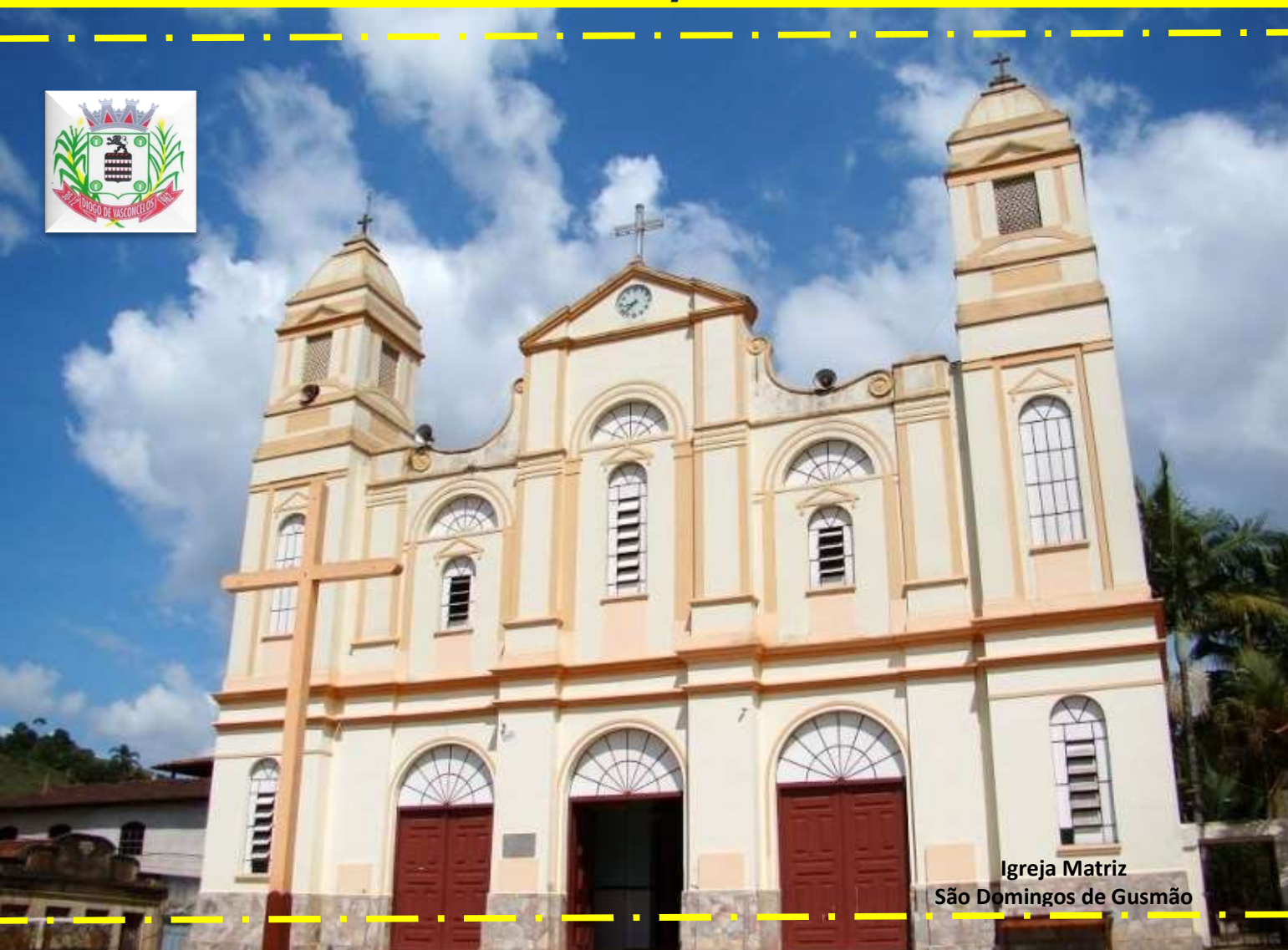
Igreja Matriz São Domingos de Gusmão

Prefeitura Municipal de Diogo de Vasconcelos Conselho Municipal de Turismo – COMTUR